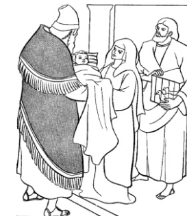
sv. Blaž, biskup i mučenik